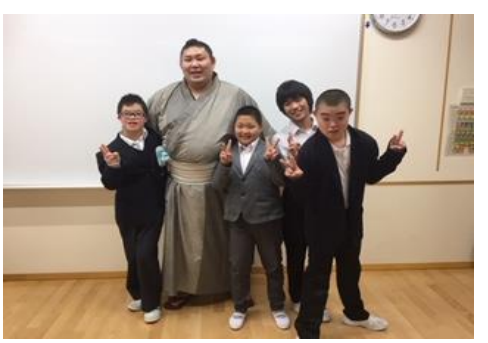
中学部の教室を回って記念撮影