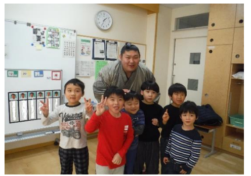
小学部の教室を回って記念撮影