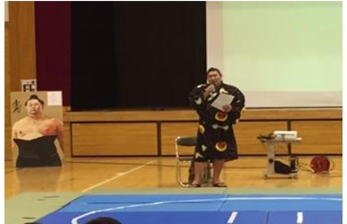
力士を夢みて相撲道に取り組んでいる話