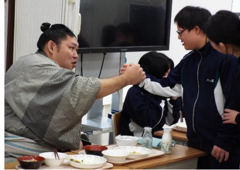
高等部1年生と一緒に給食