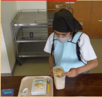
正確に計量しています