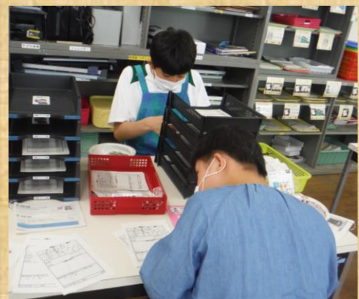
連絡帳を50枚数えてそろえます