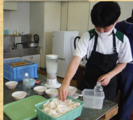
紙漉き 一つ一つの工程を 自分で確認しながら 進めます