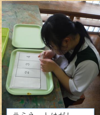
ラミネートはがし 細かい指先の動きが 必要です