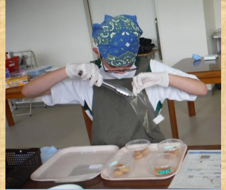
焼きあがったクッキーの袋詰め 手順書を参考に作業します