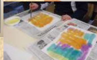
装飾用 葉っぱ作り