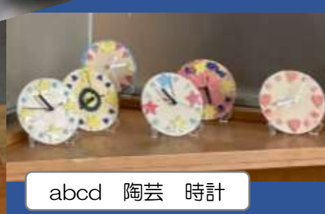
abcd 陶芸 時計