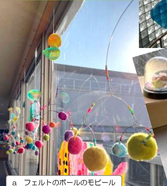
a フェルトのボールのモビール