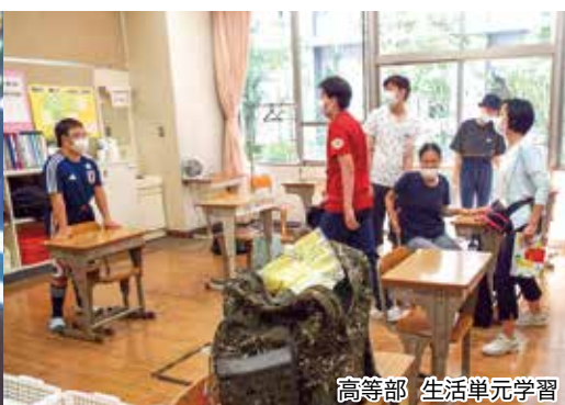
高等部 生活単元学習