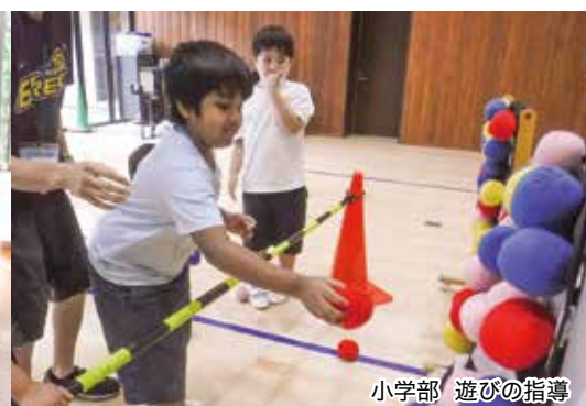
小学部 遊びの指導