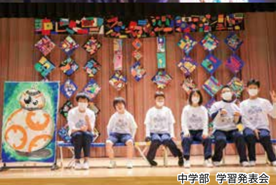
中学部 学習発表会