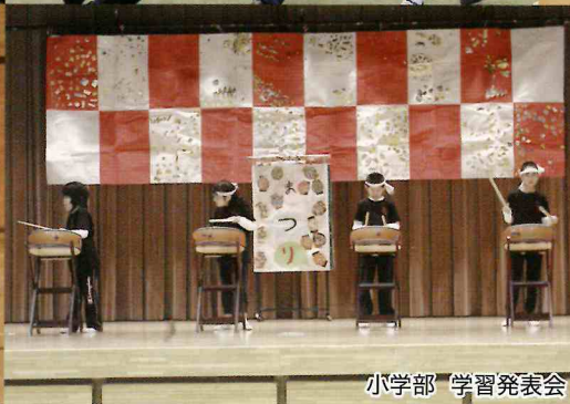
小学部 学習発表会