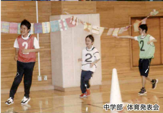
中学部 体育発表会